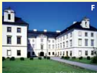
město slivovice, vlastního pečiva, Trnkobraní a rodiště valašského krále