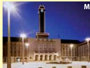
severomoravská metropole s technickými památkami a Černou loukou