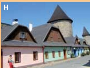
historické město poblíž Svitav, rodiště Bohuslava Martinů