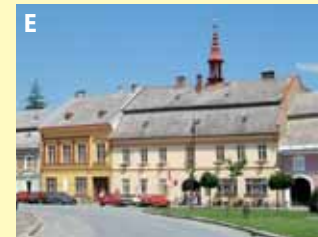
obec u Nového Města na Moravě, rodiště bratří Mrštíků a Jana Karafiáta