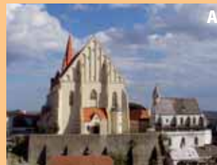
město dobrého vína, okurek a historie, které někteří vidí dvojmo