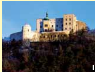
mohutný hrad, který dominuje Slovácku a v lidové písničce od něj fouká vítr