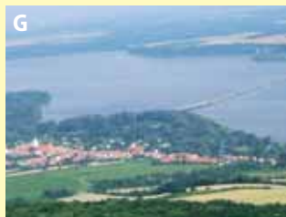
obec pod Pálavou, archeologické naleziště s Venuší