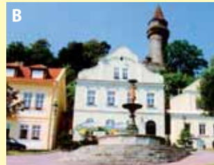
Moravský Betlém s Trúbou a Šípkou v sousedství Kopřivnice