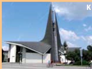
jihomoravské město s rybochodem leží nedaleko lednicko-valtického areálu